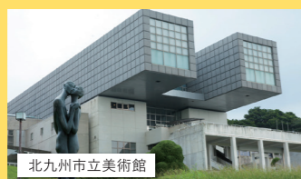
北九州市立美術館

自然あふれる公園やユニークな形の美術館など、自然と文化の調和がとれた若松・戸畑エリア。渡船の旅もオススメ。