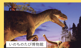
いのちのたび博物館